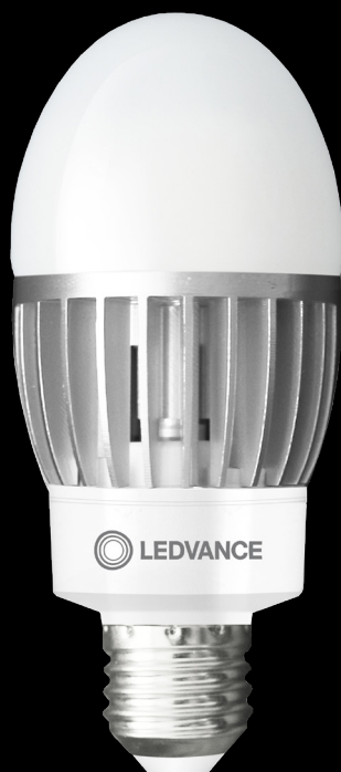
HQL LED P

Die NAV/HQL LED Familie von LEDVANCE bietet herausragende Effizienz, perfekt für den Außeneinsatz, wo Lichtleistung und Verlässlichkeit zählen. Diese energiesparenden Lampen entsprechen den hohen Anforderungen Ihrer Kunden und tragen zur Reduzierung der Betriebskosten bei.