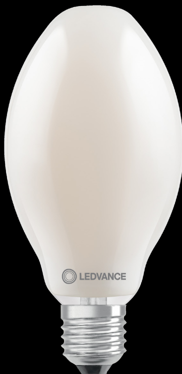
HQL LED FIL V